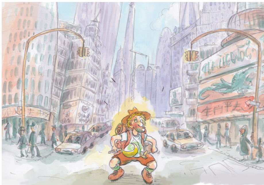
Illustration : Claire Astruc